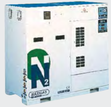
Modulaire PSA stikstofgeneratoren